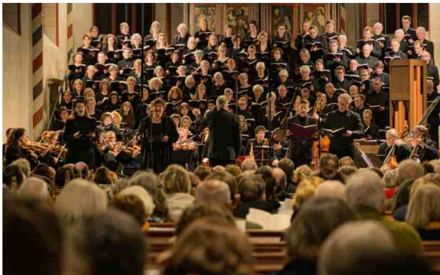
Die Jacobikantorei bei der Erstaufführung der Markuspassion von Nikolaus Matthes