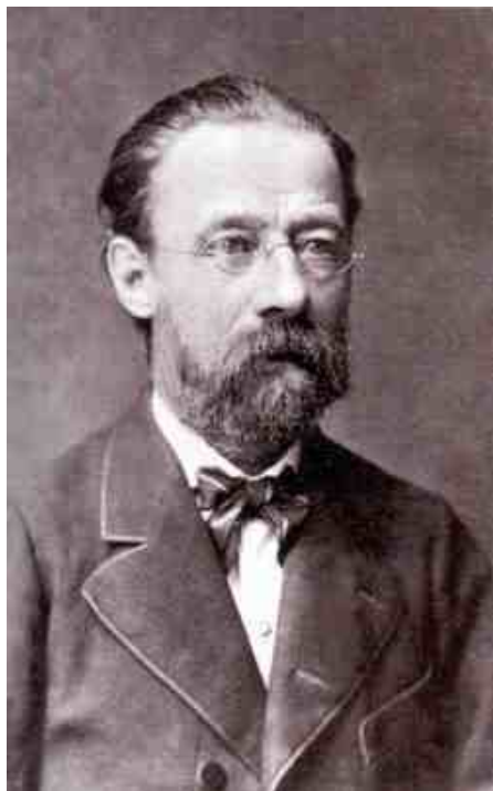
Bedřich Smetana (1824-1884)