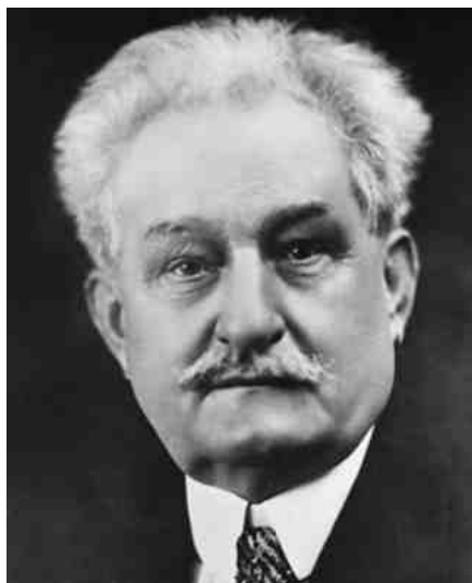
Leoš Janáček (1854 -1928)