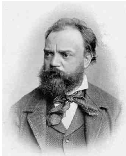
Antonín Dvořák (1841 -1904)